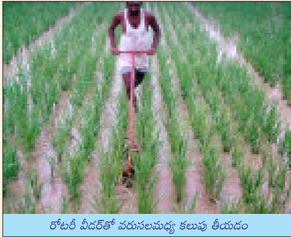
రోటరీ వీడర్తో వరుసలమధ్య కలుపు తీయడం

మొక్కలు నేలలోనే కలిసిపోయి అవికూడా పచ్చిరొట్ట ఎరువులాగా సత్తువనిస్తాయి. ప్రతీ సారీ ఈ వీడర్ను నడపడంవలన ఎకరాకు సుమారు 400 కిలోల పచ్చిరొట్ట భూమికి చేకూరుతుంది. రోటరీ వీడర్ను నడపడంవలన కలుపును నివారించడమే