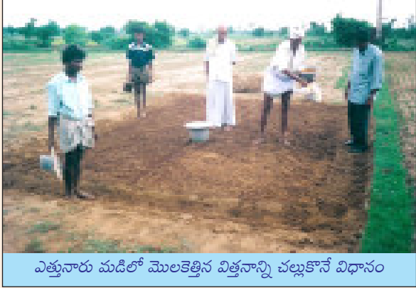
ఎత్తునారు మడిలో మొలకెత్తిన విత్తనాన్ని చల్లుకొనే విధానం

6. నారు పోసే విధానం : ఒక ఎకరా పొలంలో నాటేందుకు ఒక సెంటు నారుమడిలో పెంచిన నారు సరిపోతుంది. 2 కిలోల వరి విత్తనాన్ని 1 సెంటు నారుమడిలో చల్లుకోవాలి. 'శ్రీ' పద్ధతిలో నారుపోయడానికి ఎత్తైన చిన్న చిన్న మడులను (మిరపనారు మళ్ళు లాగా) తయారు చేసుకోవాలి. ఈ నారు మడులను ప్రధాన పొలంలోని అడుసులో నైనా లేక పొలం బయట మెట్టలోనైనా తయారు చేసుకొనవచ్చును.