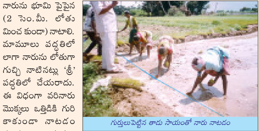
గుర్తులుపెట్టిన తాడు సాయంతో నారు నాటడం

10. పొలంలో నాటే పద్ధతి: నాటడానికి వచ్చిన కూలీలు తమ తమ చేతుల్లో పట్టేటంత నారును మట్టితోపాటు పళ్ళాలనుండి తీసుకొని గుర్తులు పెట్టిన చోట ఒక్కో కర్రను గింజ, బురదతో సహా నాటాలి. మార్కరు లాగి గీతలు గీసిన పొలంలో అయితే రెండు గీతలు కలిసే చోట ఒక్కో కర్రను నాటాలి. 'శ్రీ' పద్ధతిలో వీలైనంతవరకూ