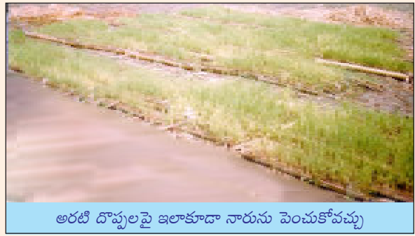
అరటి దొప్పలపై ఇలాకూడా నారును పెంచుకోవచ్చు

భూమిని మెత్తగా దున్ని / దమ్ము చేసి ఎత్తుగా వుండేటట్లు తయారు చేసుకొని చుట్టూ కాలువ తీయాలి. తడిమట్టి జారిపోకుండా నారుమడి చుట్టూ చెక్కలతోగాని, కొబ్బరిమట్టలతోగాని, వెదురుబొంగులతోగాని ఊతం ఏర్పాటు చేసుకోవాలి. నారుమడి తయారు చేసుకున్న తర్వాత మడిపై బాగా చివికిన మెత్తటి పశువుల ఎరువును లేక వర్మికంపోస్టును పలుచని పొరగా అర అంగుళం మందాన