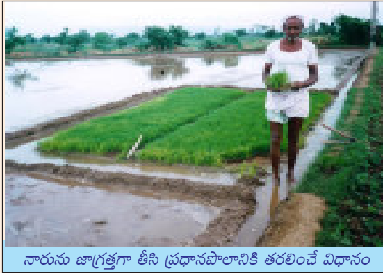
నారును జాగ్రత్తగా తీసి ప్రధానపొలానికి తరలించే విధానం

9. నారు తీసే విధానం : 'శ్రీ' పద్ధతిలో 8-12 రోజుల వయసు కల్గిన లేతనారు నాటడం వలన నారును చాలా జాగ్రత్తగా మడినుంచి వేరుచేయాలి. సాంప్రదాయ పద్ధతిలో లాగా ఇక్కడ నారు పెరకడం, కట్టలు కట్టడం వంటివి చేయకూడదు. 8-12 రోజుల వయస్సులో నారు 2 ఆకులు కలిగి 10-12 సెం.మీ. పొడు వుండి, గింజ మరియు వేర్లను కలిగివుంటుంది. కాబట్టి నారును తీసేటప్పుడు చాలా జాగ్రత్తగా గింజ మరియు