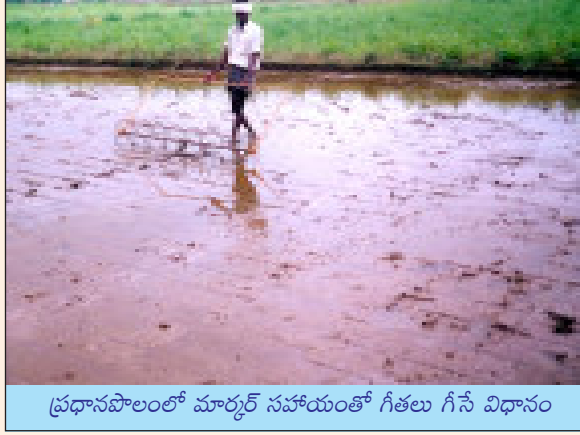
ప్రధానపొలంలో మార్కర్ సహాయంతో గీతలు గీసే విధానం

గుర్తులు పెట్టాలి. పొలంలో పట్టుకొని రంగు దారాల ముడులు ఉన్నచోట కూలీలను ఒక్కో కర్ర పెట్టమనాలి. ఒక లైన్ నాటడం మార్తయిన తర్వాత 25 సెం.మీ. ఎడంతో నైలాన్ తాడును ముందుకు జరపాలి. ఈ విధంగా ప్రతి 25 సెం.మీ. దూరంతో