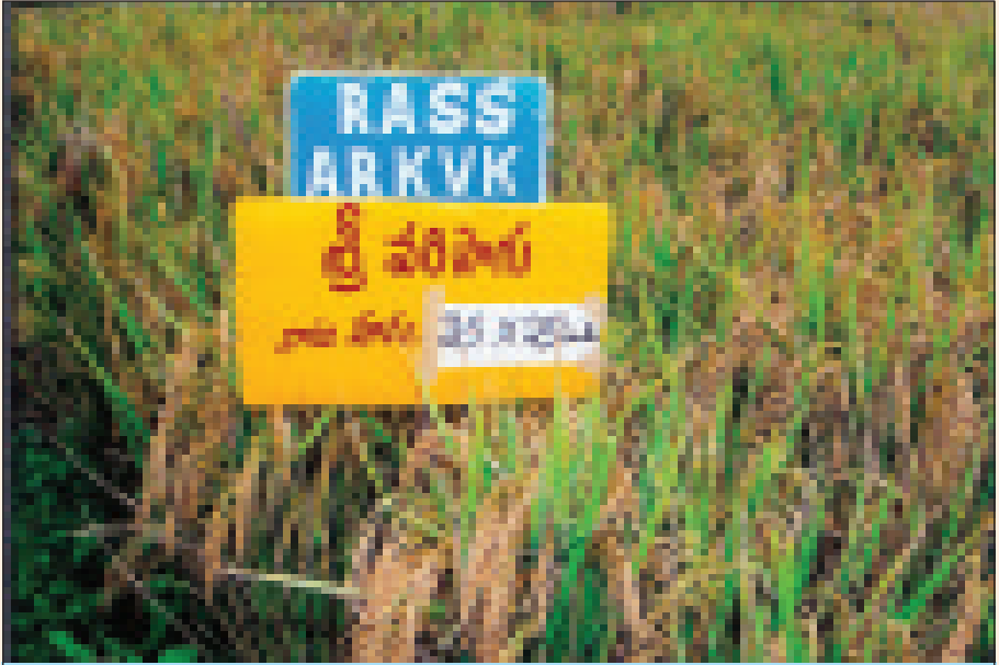
కృషి విజ్ఞాన కేంద్రం వారి ప్రదర్శనా క్షేత్రంలో విరగ కాసిన 'శ్రీ' వరి పైరు

జవాబు : లేత నారు నాటేటప్పుడు మంచి ఆరోగ్యకరమైన కర్రను నాటితే చనిపోవడమంటూ జరగదు. కూలీలు అక్కడక్కడా బలహీనమైన కర్రలను నాటడం సహజం. ఇవి చనిపోవడంతో ఏర్పడిన ఖాళీలలో నాటకుండా మిగిలివున్న నారుని ఈ ఖాళీలలో నాటుకొని దిగుబడి తగ్గకుండా చూసుకొనవచ్చును.