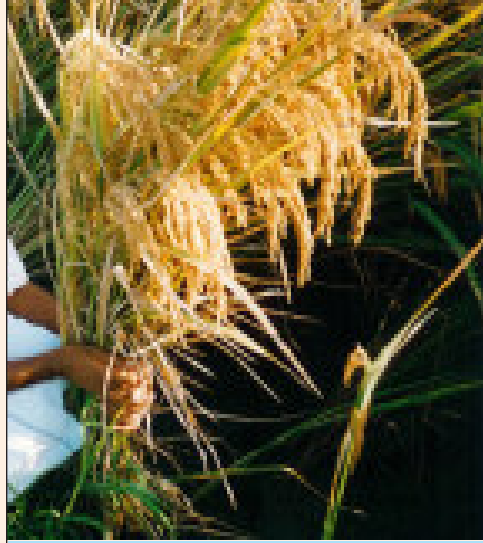
ఒకే మొక్కనుండి వచ్చిన వెన్నులు

వెన్నులూ ఒకేసారి వచ్చి పొడువుగా వుండి, బరువైన గింజలను కలిగి వుంటాయి. రాస్-ఆచార్య రంగా కృషి విజ్ఞాన కేంద్రం వారు ఖరీఫ్-2004లో జరిపిన ప్రయోగాత్మక ప్రదర్శనా క్షేత్రాలలో ఒక ఎకరా నుండి 50 బస్తాల (ఒక్కో బస్తా 75 కిలోలు) దిగుబడిని రికార్డు చేయడం జరిగినది. ఆంధ్రప్రదేశ్ లో వివిధ ప్రాంతాలలో వ్యవసాయ యూనివర్సిటీ వారు జరిపిన ప్రదర్శనా క్షేత్రాల వివరాలను గమనిస్తే 'శ్రీ' సేద్యం 'సిరులు' కురిపించే సేద్యమని రైతులకు అర్థమవుతుంది.